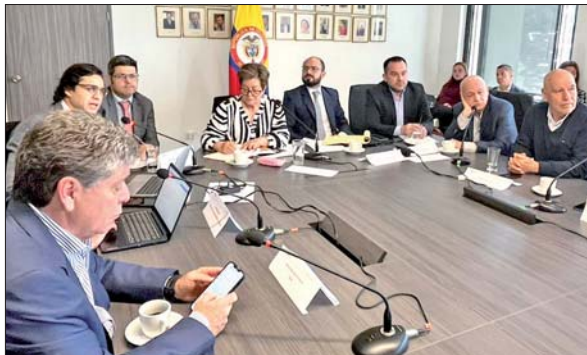
UN ENFRENTAMIENTO entre Fenalco y el Gobierno se presentó ayer en la mesa de Concertación Laboral y Salarial.

Cabal Sanclemente indicó en la Constancia, que las discusiones que se llevan a cabo en el marco de